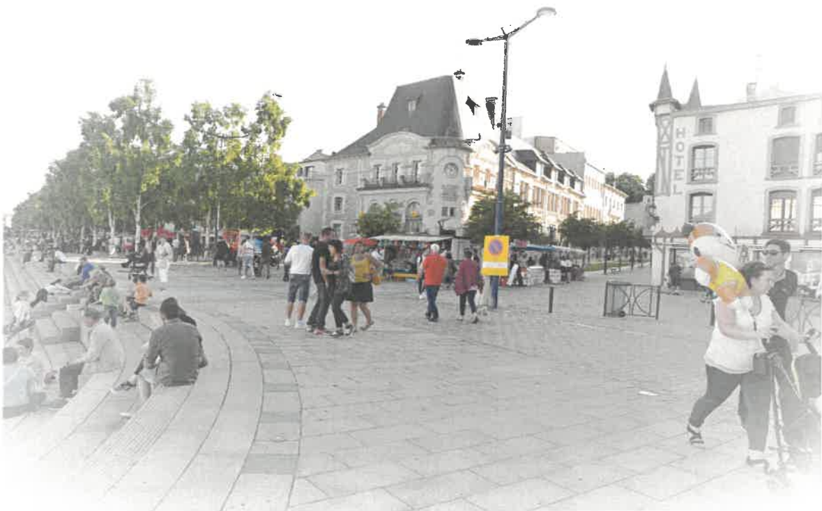
Type d'architecture quai de Londres

Cette méthode a permis d'établir les caractéristiques majeures de chaque ensemble et de définir des orientations au regard de la délimitation du futur SPR.